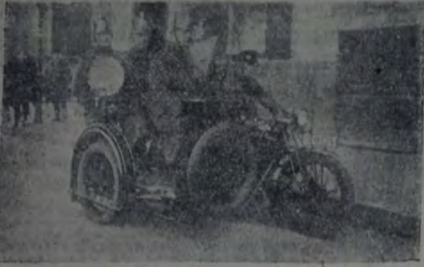
MOTOCICLETA CON SIDECAR, PROVISTA DE POTENTE REFLECTOR, usada por la policía de Berlín para perseguir a los malhechores e infractores de las ordenanzas de tráfico.