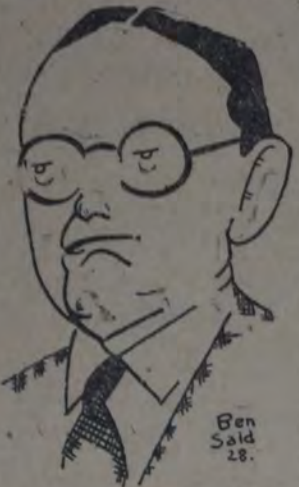
EL VALIENTE ESCRITOR ESPAÑOL cuyo reciente libro "La Agonía Antillana" ha sido prohibido en Cuba por el general Machado

ciadas por la ventaja arancelaria proporcionada por Estados Unidos a Cuba y consistente en la rebaja de un 20 por ciento de los derechos de entrada al azúcar cubano.